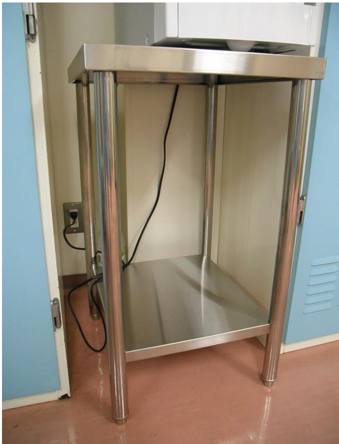
△ 置台 1台 TK-45特