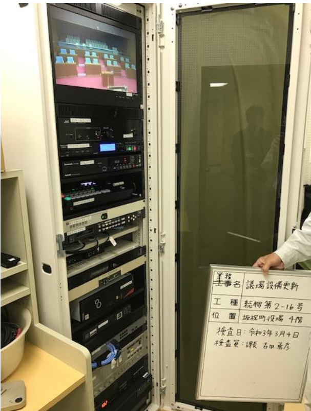
録音室設置ラック モニター、会議システムパソコン、UPS 等