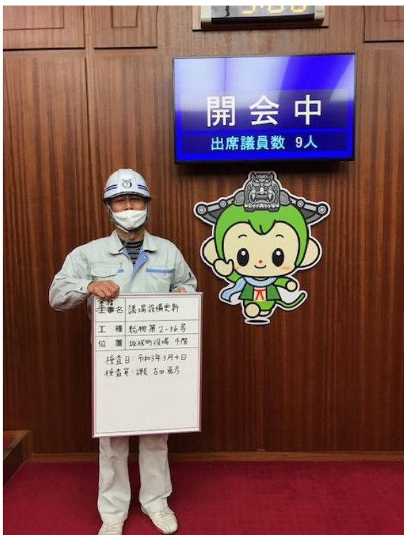
場内表示用モニター 「開会中」表示画面