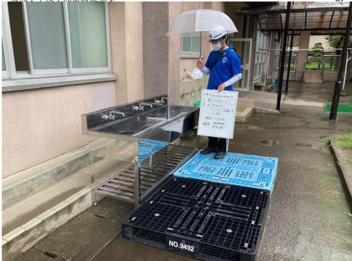
△ 全槽ステンレスシンク 東側1箇所設置口