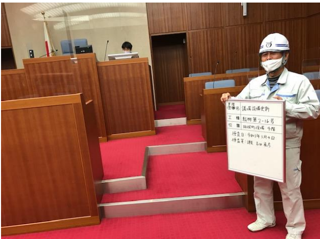
議長席及び執行部側