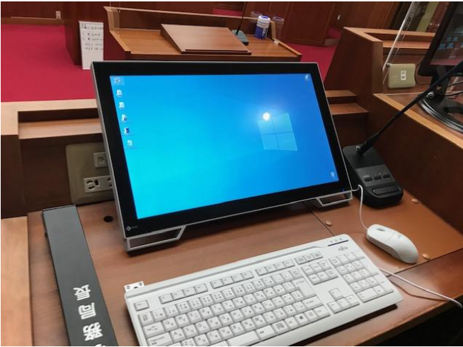
事務局長席タッチパネルモニター デスクトップ画面