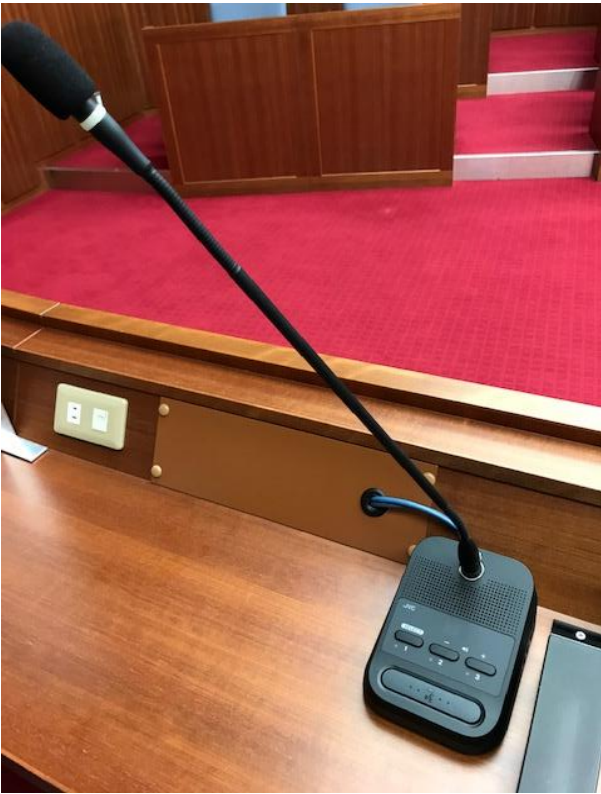
グースネックマイクロホン