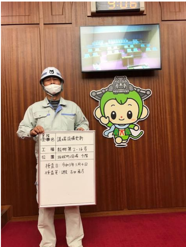
場内表示用モニター 議員席表示時