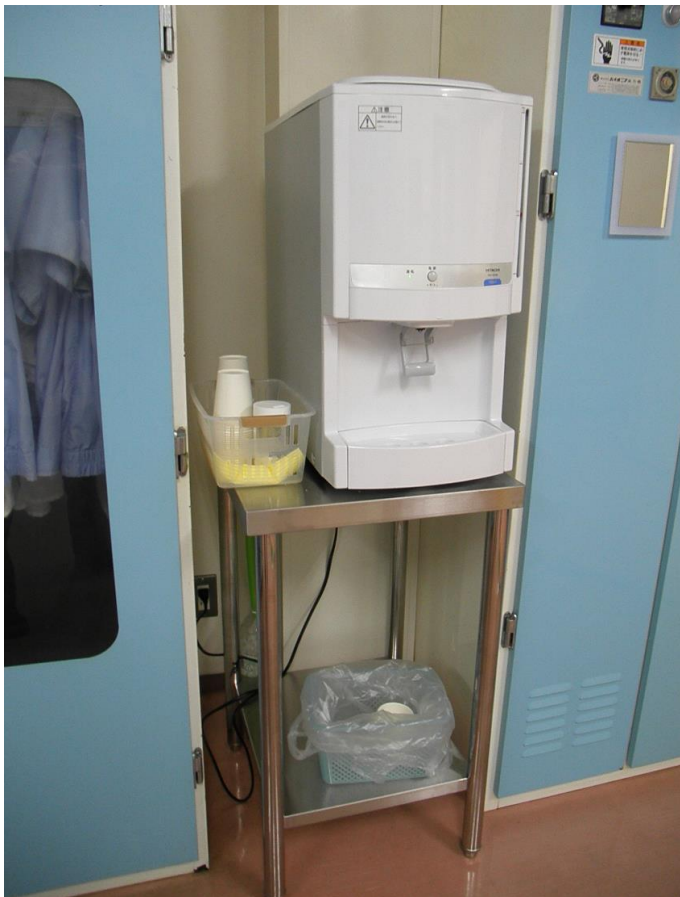
△ ウォータークーラー 1台 RW-1810B□