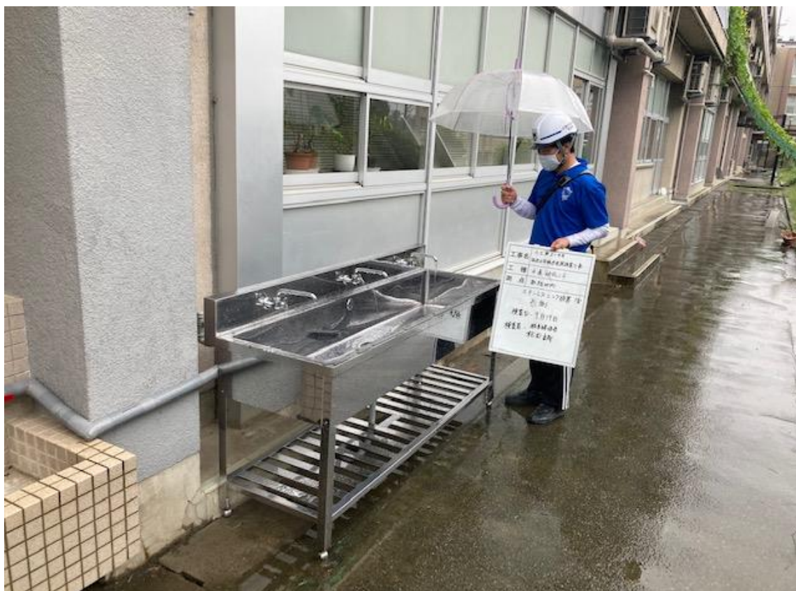
△ 全槽ステンレスシンク 西側1箇所設置口