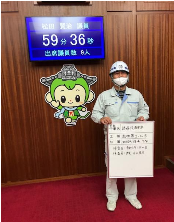
場内表示用モニター 議員質問時の残時間表示