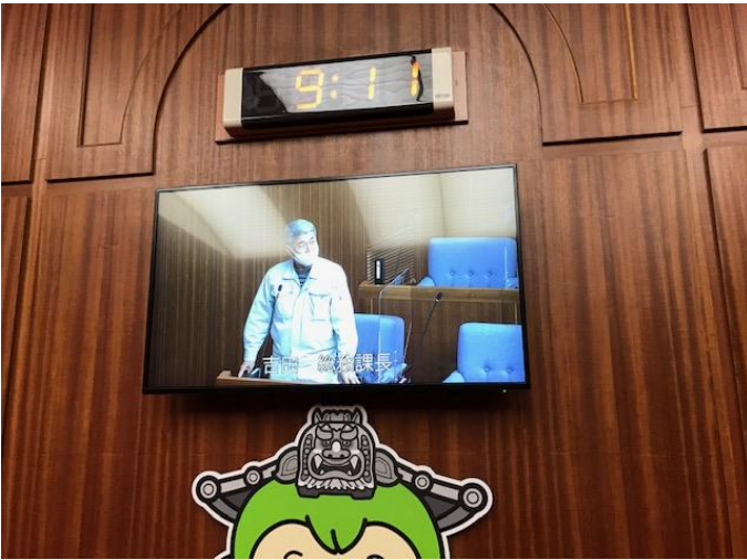
場内表示用モニター 総務課長マイク割り当て時画面