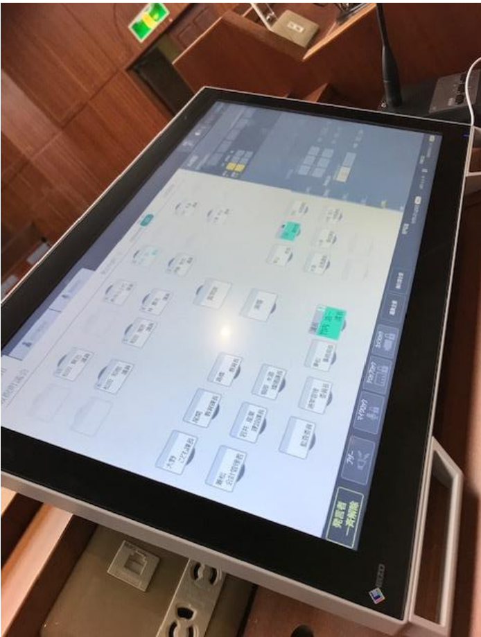
事務局長席タッチパネルモニター マイク割り当て画面